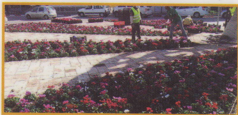
שתילה בכיכר הקניון